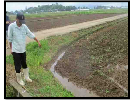
農道整備(グレーダ整地)