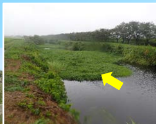
ナガエツルノゲイトウ群落