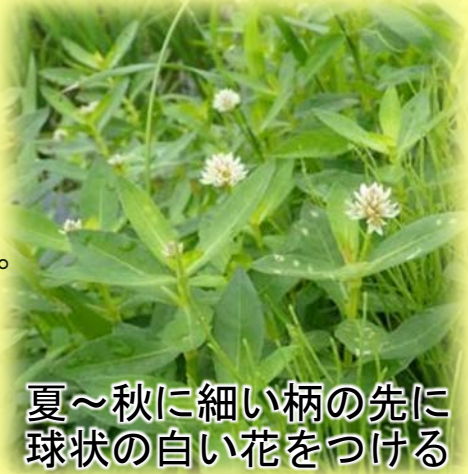
夏～秋に細い柄の先に球状の白い花をつける